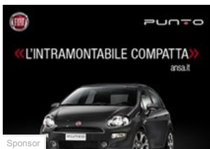
Nuova Fiat Punto: quello da sapere sulla parte... (Fiat)