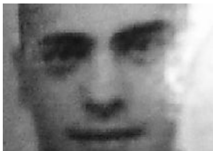
"Ecco che accadeva in quella casa"