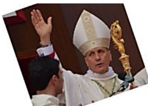
«Così ho fatto partire l'indagine sul vescovo»