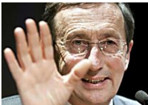
Fini: "Meloni, che delusione Silvio è il più..."